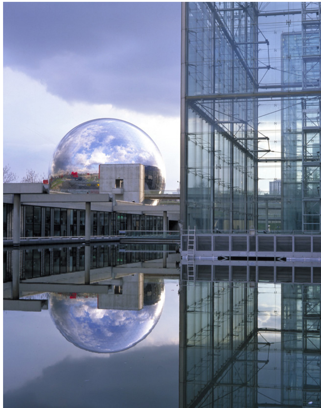
LA GÉODE ET SERRE BIOCLIMATIQUE