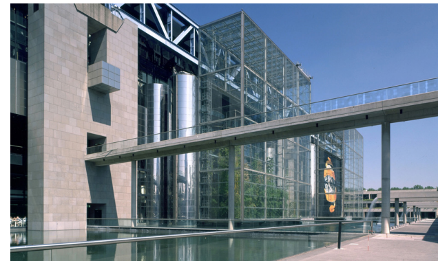
VUE EXTÉRIEURE CÔTÉ PARC