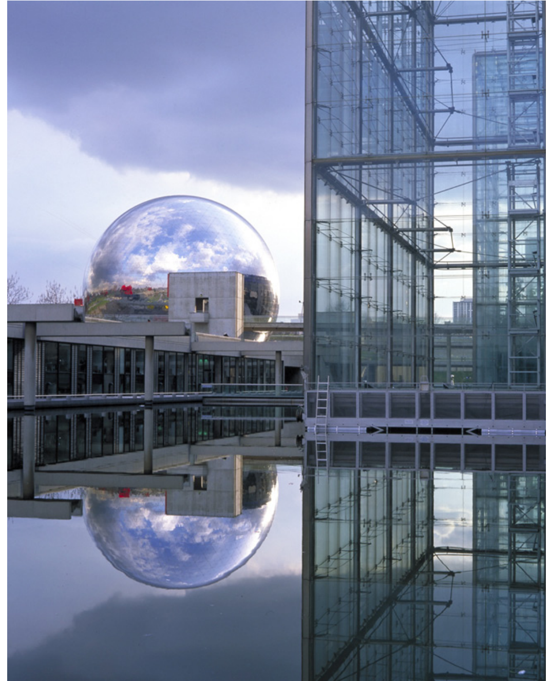
LA GÉODE ET SERRE BIOCLIMATIQUE