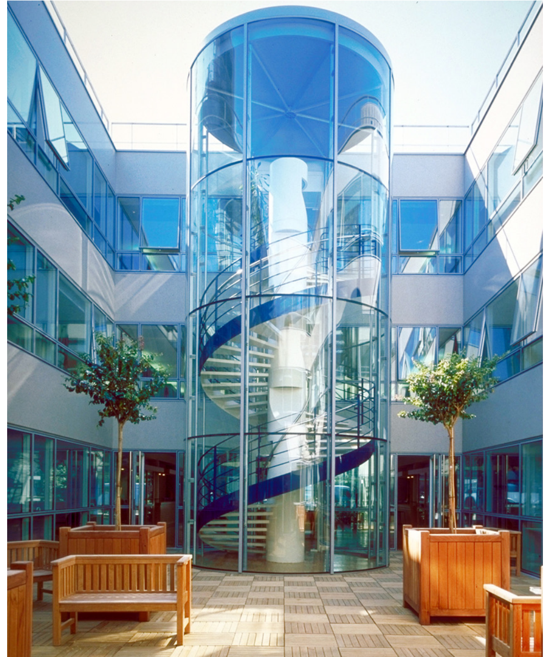
PATIO CENTRAL, ESPACE DE DÉTENTE