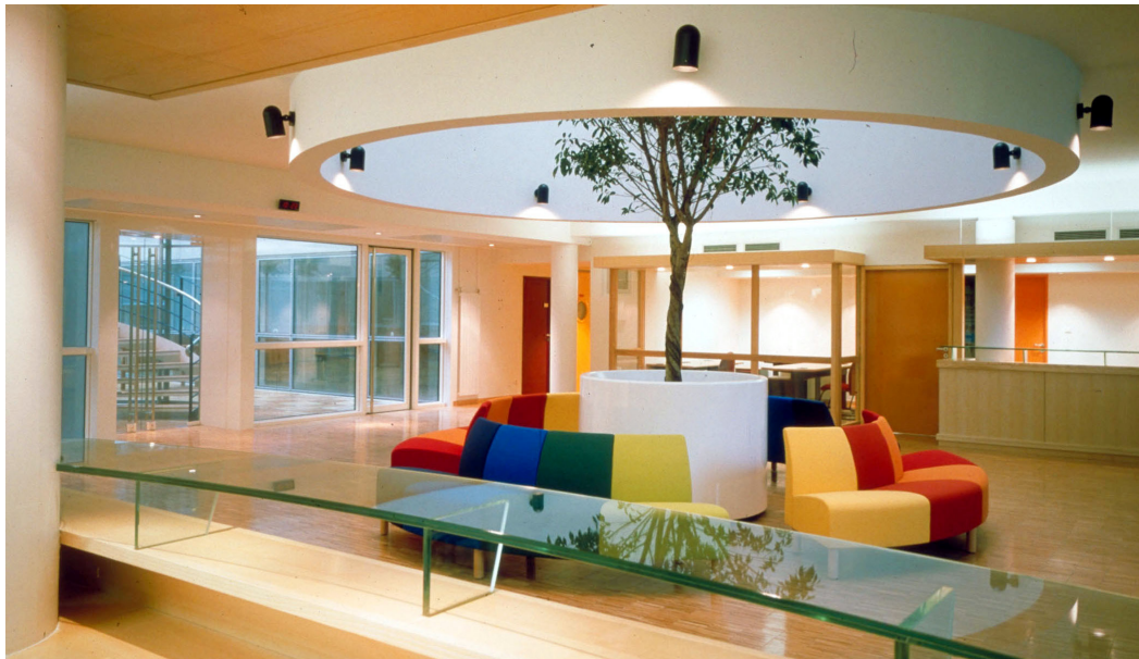
ESPACE DE VIE SOCIALE S'ARTICULANT AUTOUR D'UN PUIT DE LUMIÈRE

Les espaces de réunion, de détente et de soins s'articulent autour d'un patio central. L'échelle du bâtiment est intime et les matériaux employés sont chaleureux. Les espaces sont très ouverts et lumineux. Les chambres sont volontairement petites pour favoriser les espaces collectifs et la vie sociale, elles occupent les deux niveaux supérieurs ainsi que les salons et salle de jeux autour d'un grand oculus en toiture qui capte la lumière naturelle et la diffuse sur toute la hauteur de l'édifice.