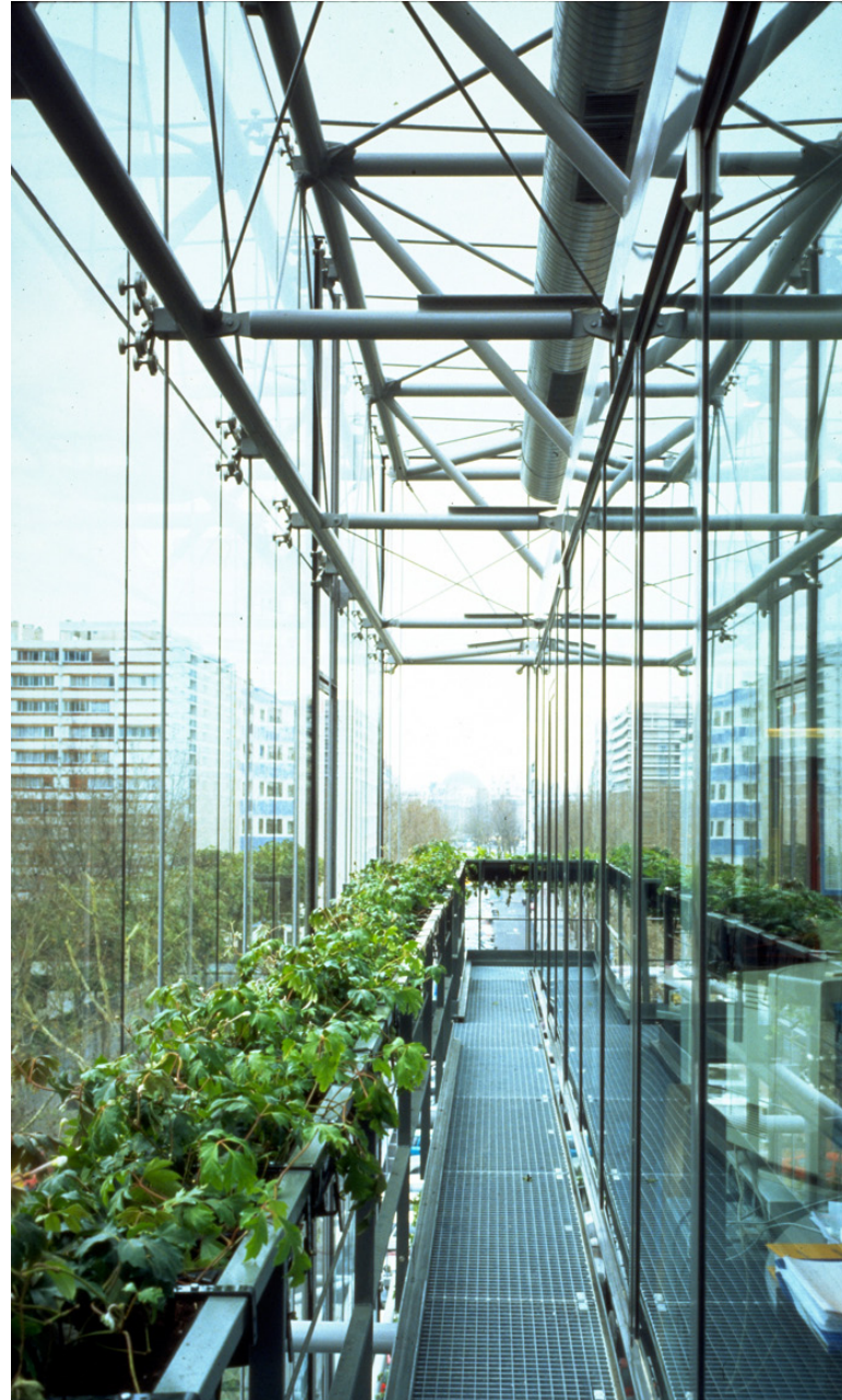
FACADE BIOCLIMATIQUE - DOUBLE PEAU