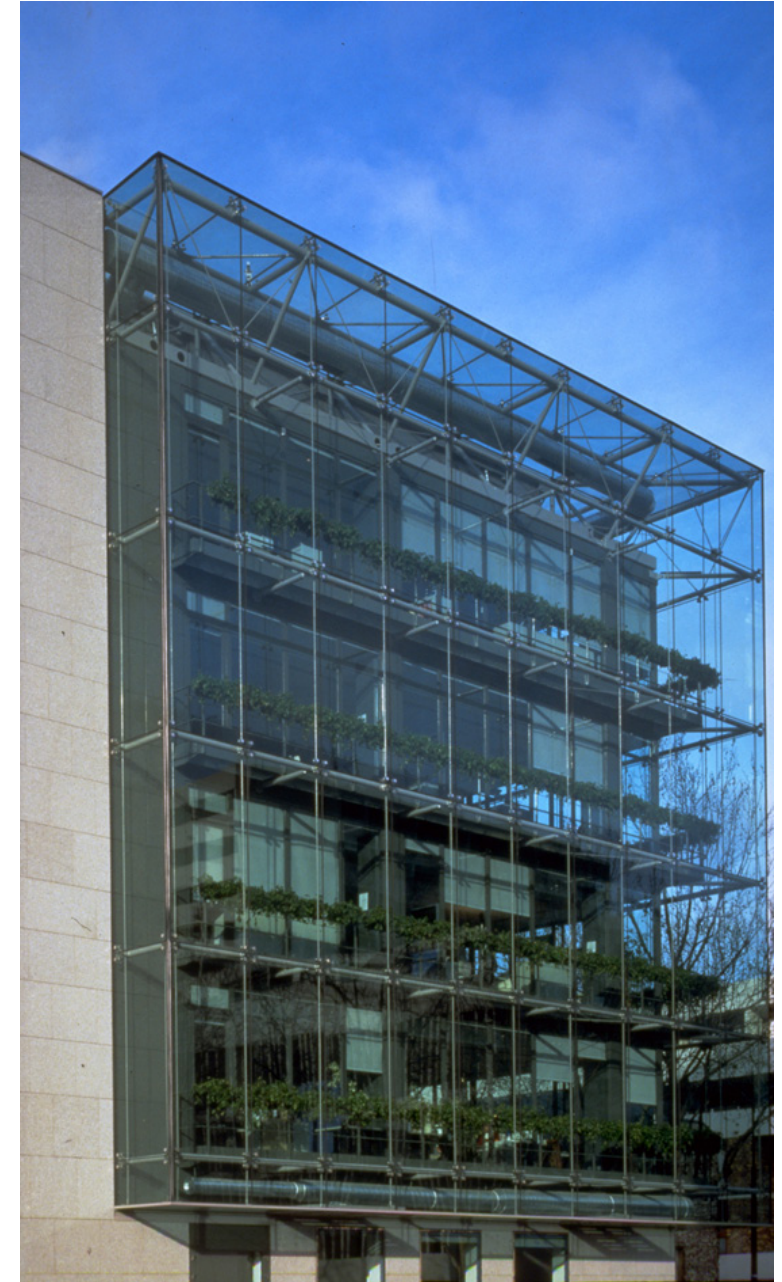
FACADE SUR LA RUE DE REULLY