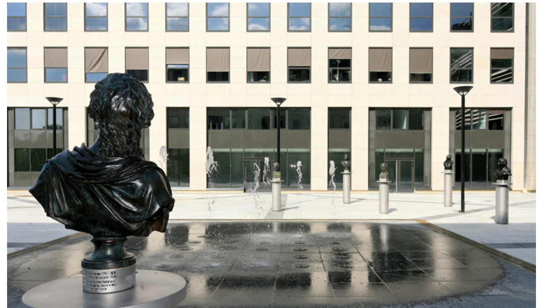
VUE DE LA FONTAINE