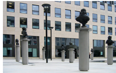
VUE DE LA PLACE