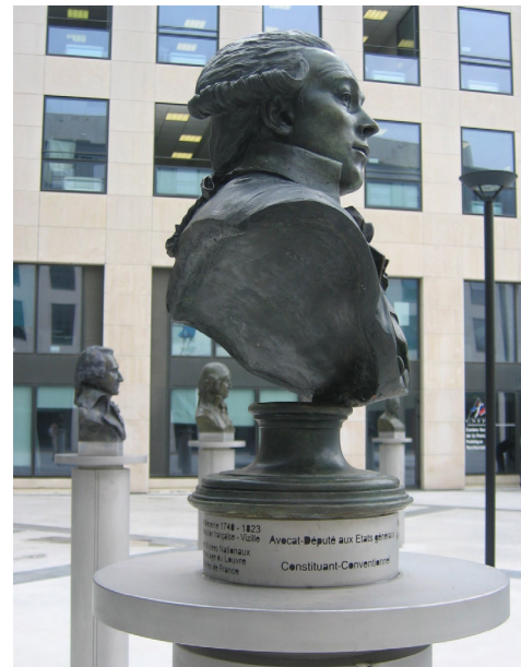
AMÉNAGEMENT DES BUSTES