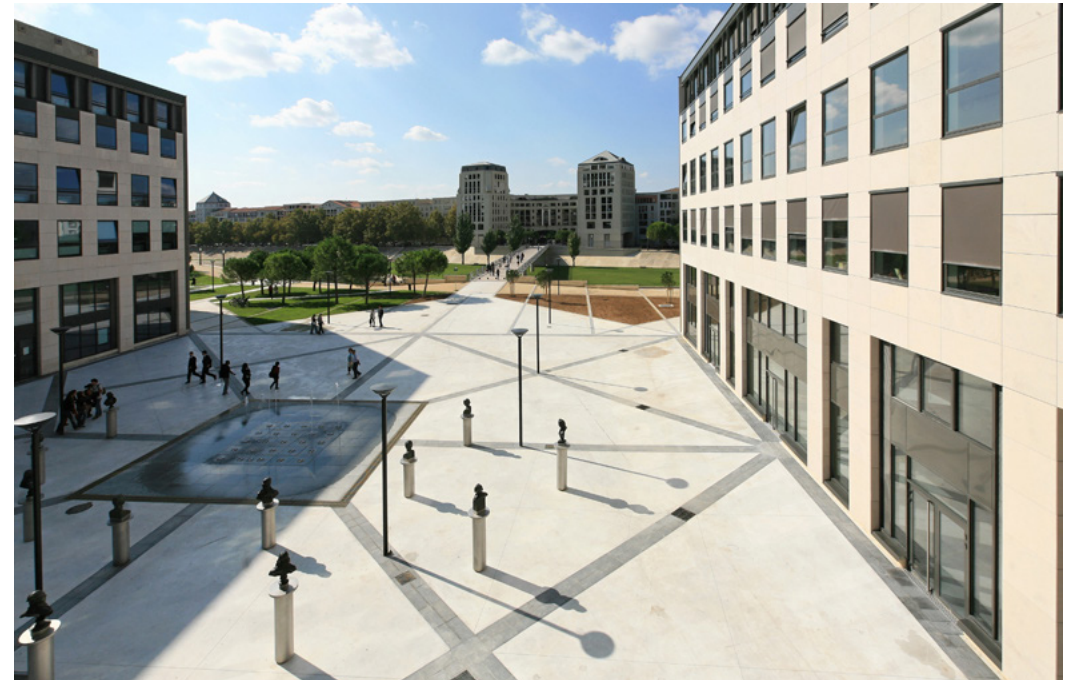
VUE D'ENSEMBLE DE LA PLACE

La Ville de Montpellier souhaitait réunir sur cette place carrée, axée sur la passerelle des Barons de Caravètes, quinze bustes de révolutionnaires et une fontaine. Les bustes en bronze devaient être disposés sur des socles de proportion et de hauteur adaptées à l'échelle de la place et des piétons.